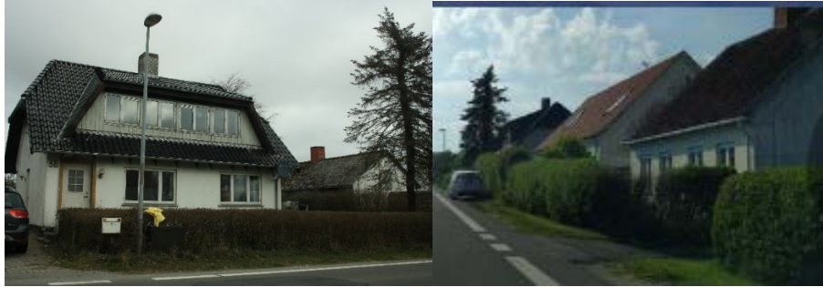
Matrikel h: Det første hus på landevejen over for købmanden efterfulgt af Matrikel c og matrikel i