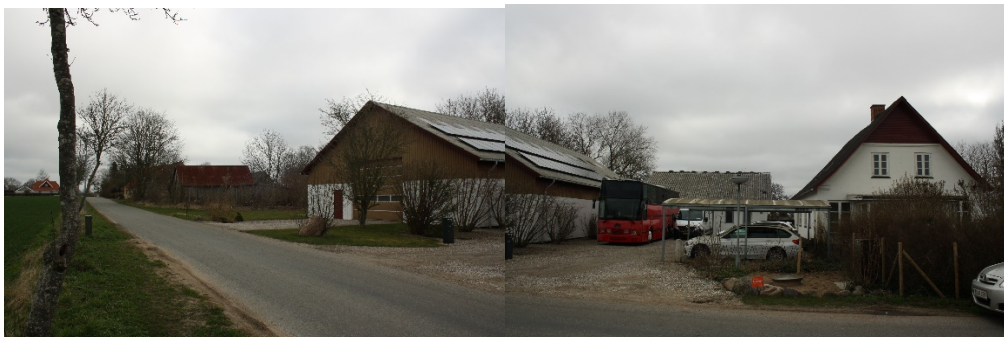
Gård matrikel Skovridergårdsvej 3, matrikel 2a