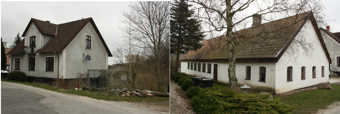
Matrikel 6a: Smedien med stuehuset til venstre og værkstedet til højre