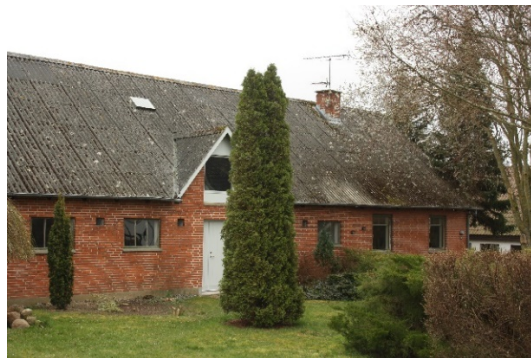
Matrikel 6c sadelmagerstedet