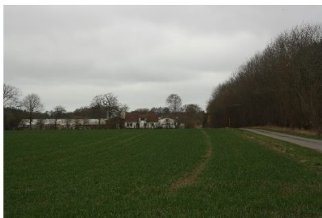
Gård matrikel 4a