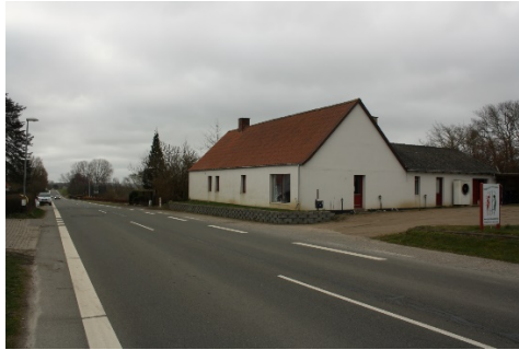
Skælskør Landevej 21, matrikel 1d: Her var der købmandsbutik