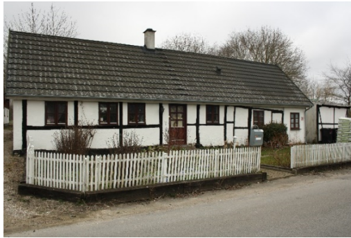
Matrikel 19 og 20c