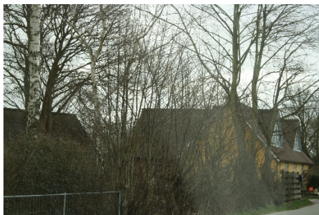
Husmandssted matrikel 14c

Mat 14: Iflg. Landbrugsministeriets Skr af august 1923 udgør Mat nr 5b, 14a og 17 af Nyrup et husmandsbrug i henhold til bestemmelserne i §3 1.stk, lov N 563 af 4.oktober 1919.