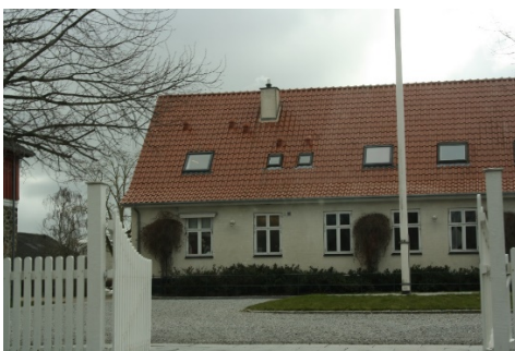
Matrikel 5a Skovridergården