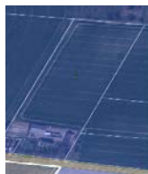
Matrikel l