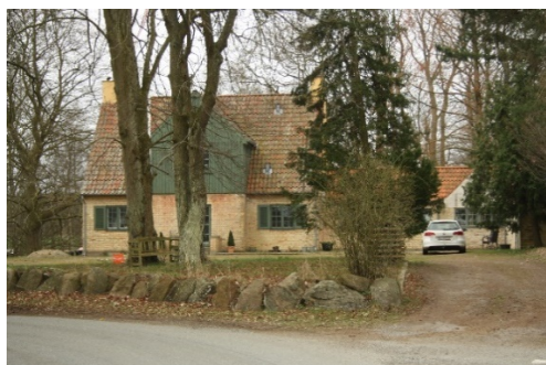
Hus matrikel Skovridergårdsvej 2, matrikel 2c

Af den oprindelige matrikel 2 er der tilsyneladende sket en deling i to: 2a på 3 Tdr.5 Sk.3Fd. et såkaldt landbrug klasse I og \frac{1}{4} Alb. og 2b: 7 Sk.1Fd og \frac{1}{2} Alb. altså et husmandsbrug. På et senere tidspunkt er der også udskilt en matrikel 2c som ligger ved siden af gården 2a: